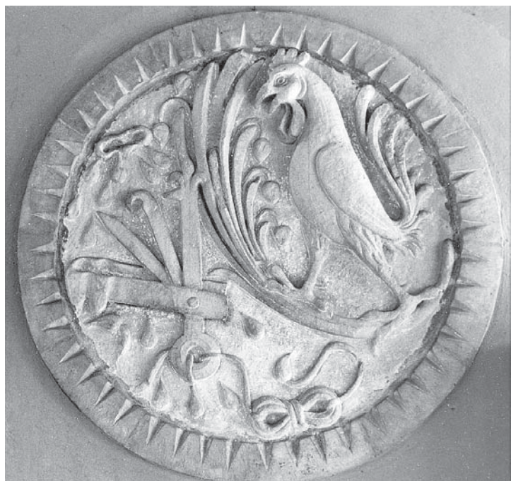
Sigillo dei Manfredi.