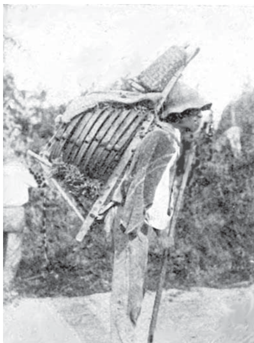
Testaiolo in cammino.

Si accontentano per ogni discesa al piano (viaggio che ha la durata di 8 giorni al massimo e che si inizia demonticando il lunedì mattina assai per tempo e monticando al sabato, per essere a casa la domenica, di portare alle loro famiglie un gruzzoletto di cinquanta lire di guadagno per settimana e per il periodo di due mesi circa (Settembre - Ottobre) e