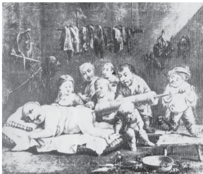
Il clistere, dipinto di Ignoto, coll. Putti, Bologna.

Gli attrezzi consistevano in una pompa e in una catinella di acqua salata che veniva aspirata e introdotta con apposito ugello nel sedere di chi aveva richiesto il "servizio". L'ugello era sempre il medesimo e serviva per tutti perchè l'acqua salata, per sua natura, avrebbe provveduto a renderlo "igienico"!