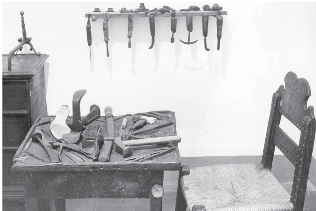
Banchetto da calzolaio, Museo Civico, Forlì.

Il ritmico tintinnare argentino di un martello sull'incudine, una fucina dove il carbone era bianco per il calore e pareva pulsare come un cuore di fuoco dentro il quale un ferro si arroventava, sfidando con la sua forza quell'incredibile ardore, fino ad arrendersi ed arrossire; un secchio d'acqua fresca dove spegnere quel rosso acceso in uno sfrigolio di protesta, un uomo