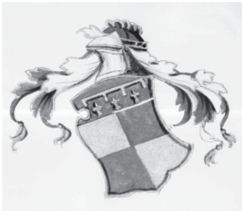
Stemma araldico dei Manfredi.