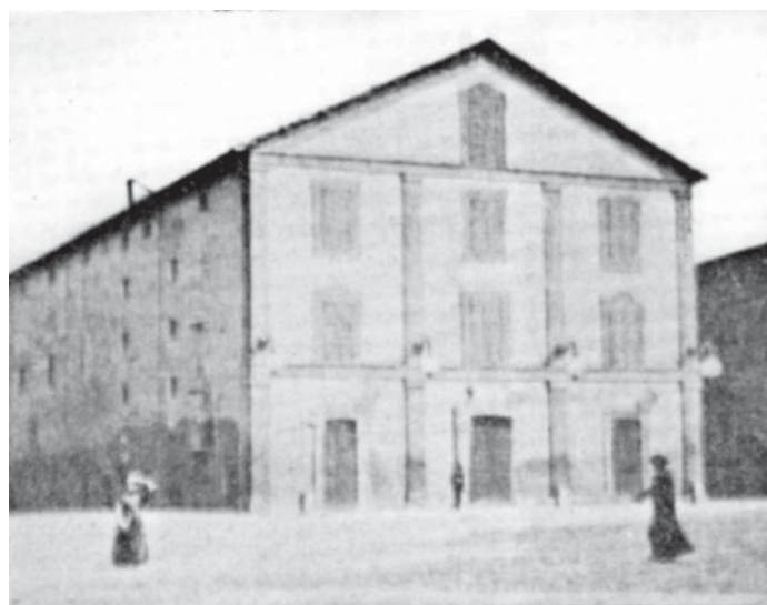
Lugo - Teatro Rossini.